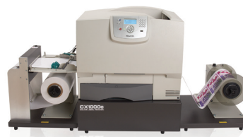
CX1000e COLOR LABEL PRINTER