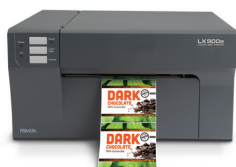
LX900e COLOR LABEL PRINTER