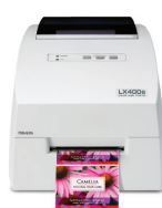
LX400e COLOR LABEL PRINTER

Des Imprimantes d'étiquettes à la demande d'impression de qualité professionnelle sont également disponibles chez Primera.