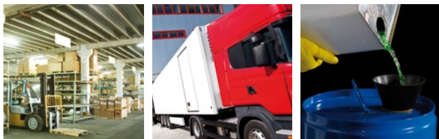
* La B-EX4T2 a été comparée aux produits concurrents en mode veille.

Les B-EX4T2 sont disponibles en 203/300 ou 600 points au pouce, permettant des impressions spécialisées en haute résolution avec une qualité d'impression supérieure.