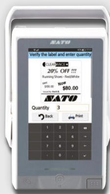
Vérifier l'aperçu et indiquer la quantité