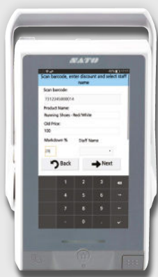
Saisir la réduction