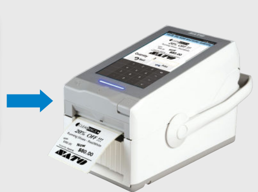
Imprimer les étiquettes

Formats et designs d'étiquettes entièrement personnalisés et calculs automatisés pour réduire les erreurs