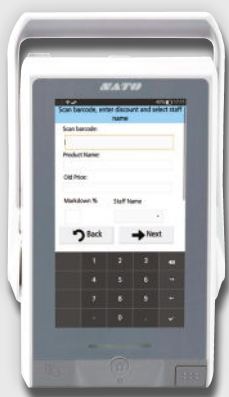
Scanner le code-barres